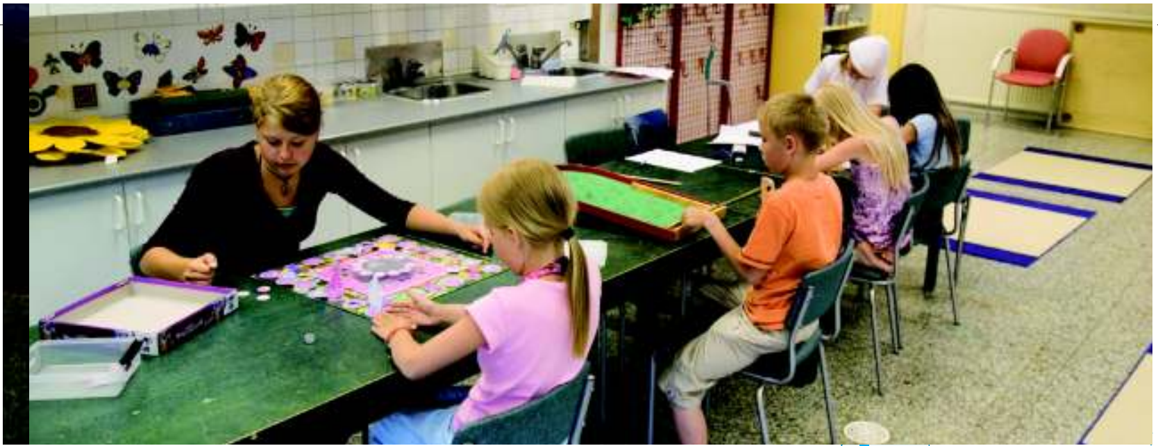
Servicii comunitare: centru de recreere pentru copiii de școală primară Lastenkaari, Finlanda