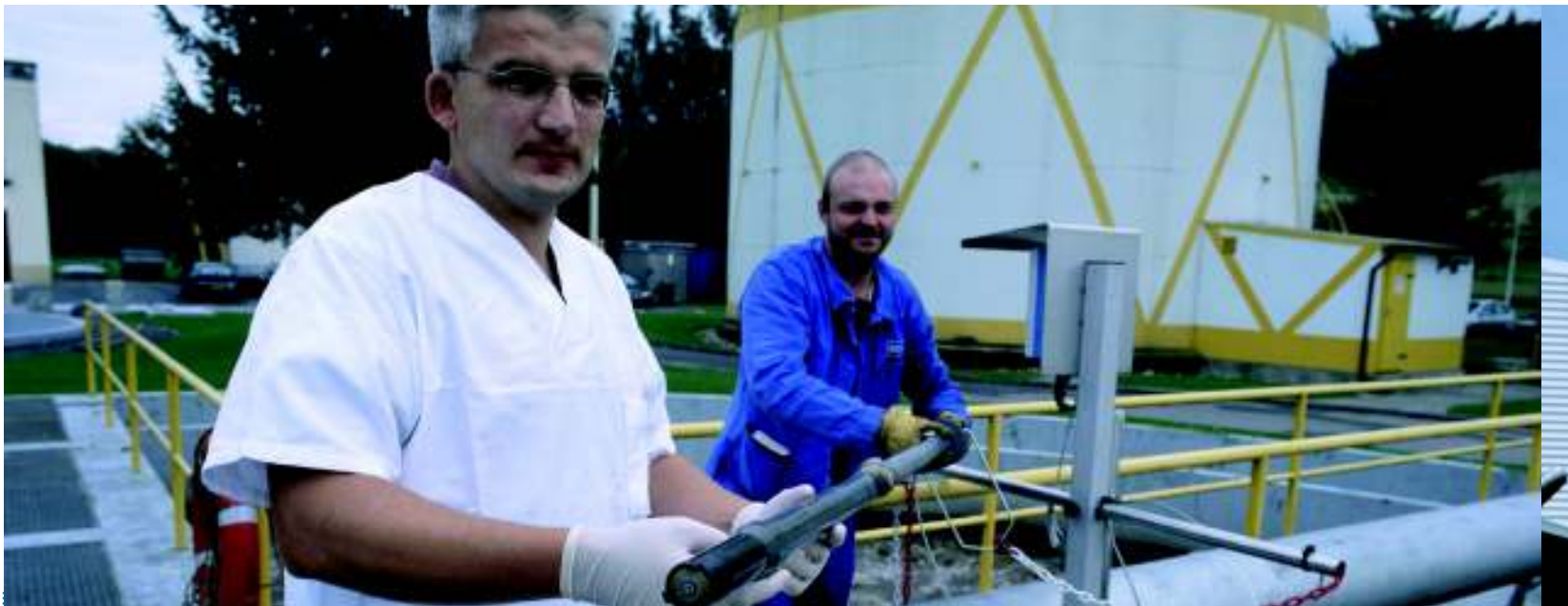
Centrul de resurse tehnologice pentru mediu: Esch-sur-Alzette, Luxemburg