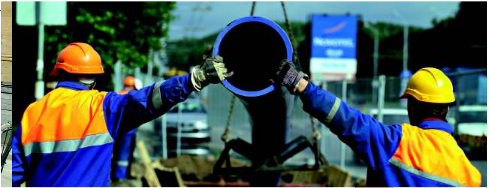
Noi conducte pentru infrastructura apă/canalizare, Lituania