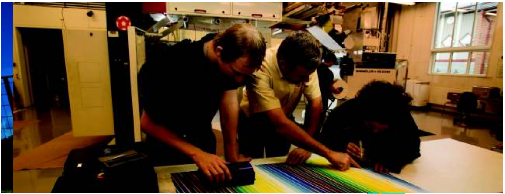
Inovare în industria grafică în Brobygrafiska, Suedia