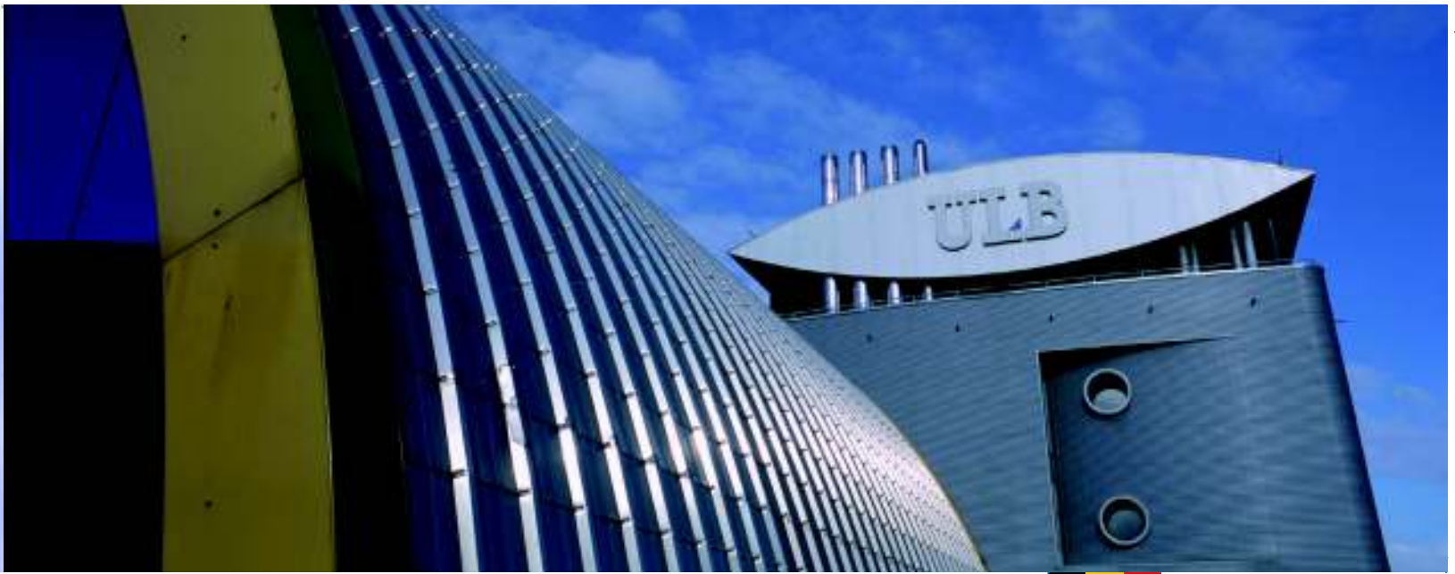
Investim în cercetare: Centrul Minerva pentru cercetare biotehologică din Charleroi, Wallonia, Belgia

■ JESSICA (Sprijin European Comun pentru Investiții Durabile în Zonele Urbane), o inițiativă a Comisiei, BEI și BCE pentru promovarea investițiilor durabile în proiecte și programe urbane. Ea face legătura dintre statele membre, regiuni și orașe cu sectorul financiar-bancar european pentru investiții mai numeroase și mai de calitate în orașe. Autoritățile care administrează programele finanțate prin Fonduri Structurale pot profita