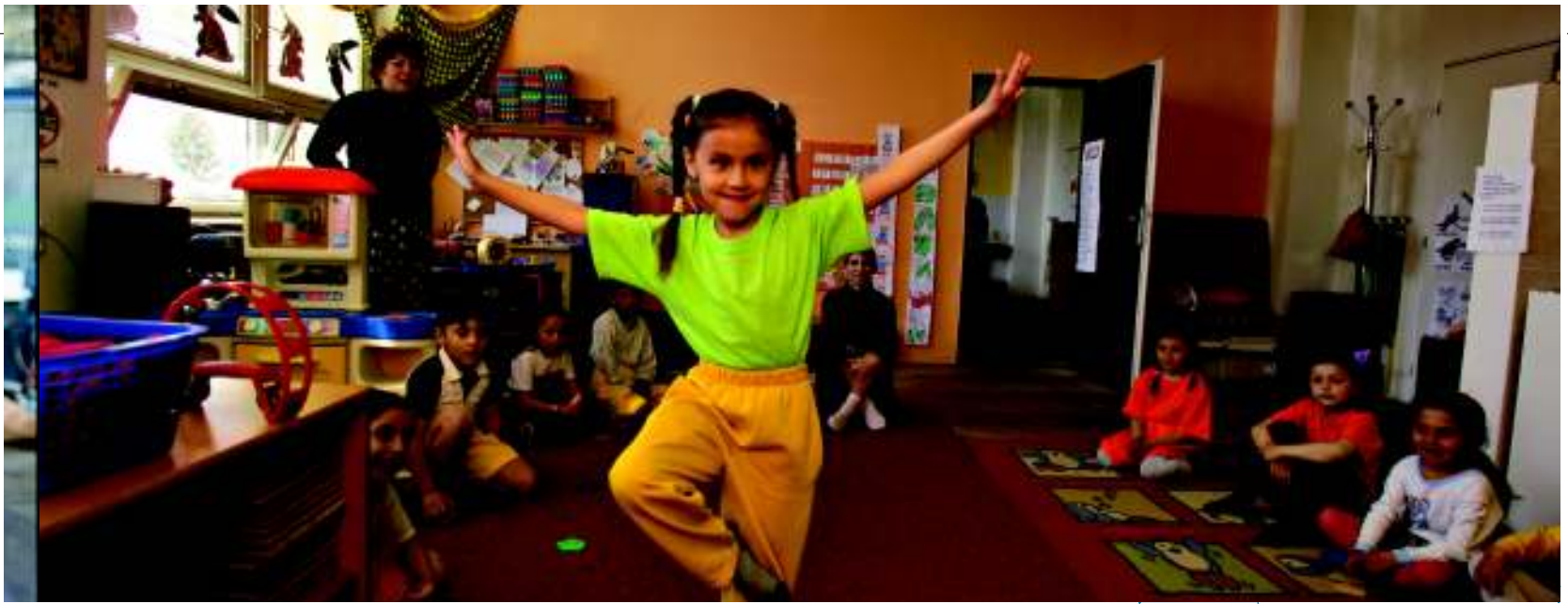
Investim în oameni: un nou centru de îngrijire a copilului la o grădiniță din Roma, Slovacia