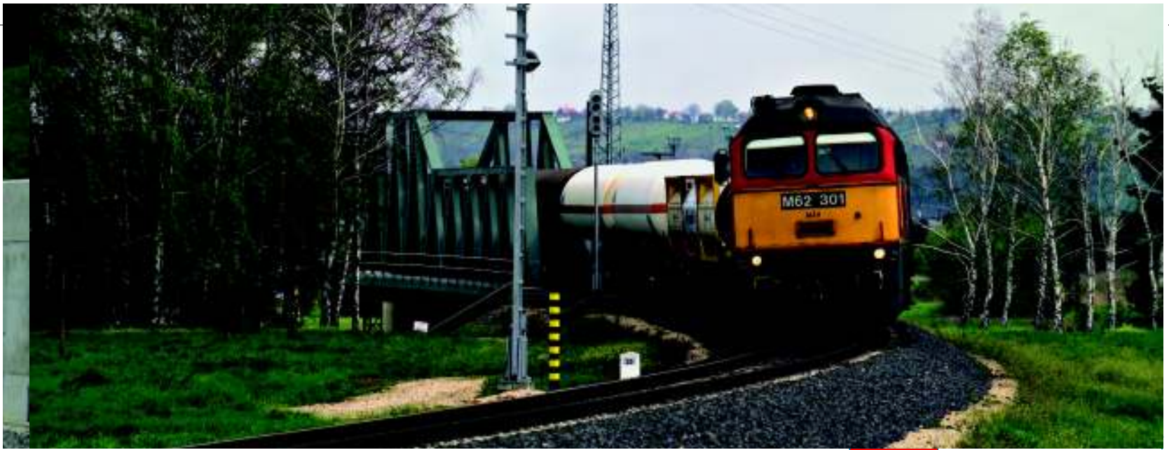
Legând țări: noua legătură feroviară între Ungaria și Slovenia