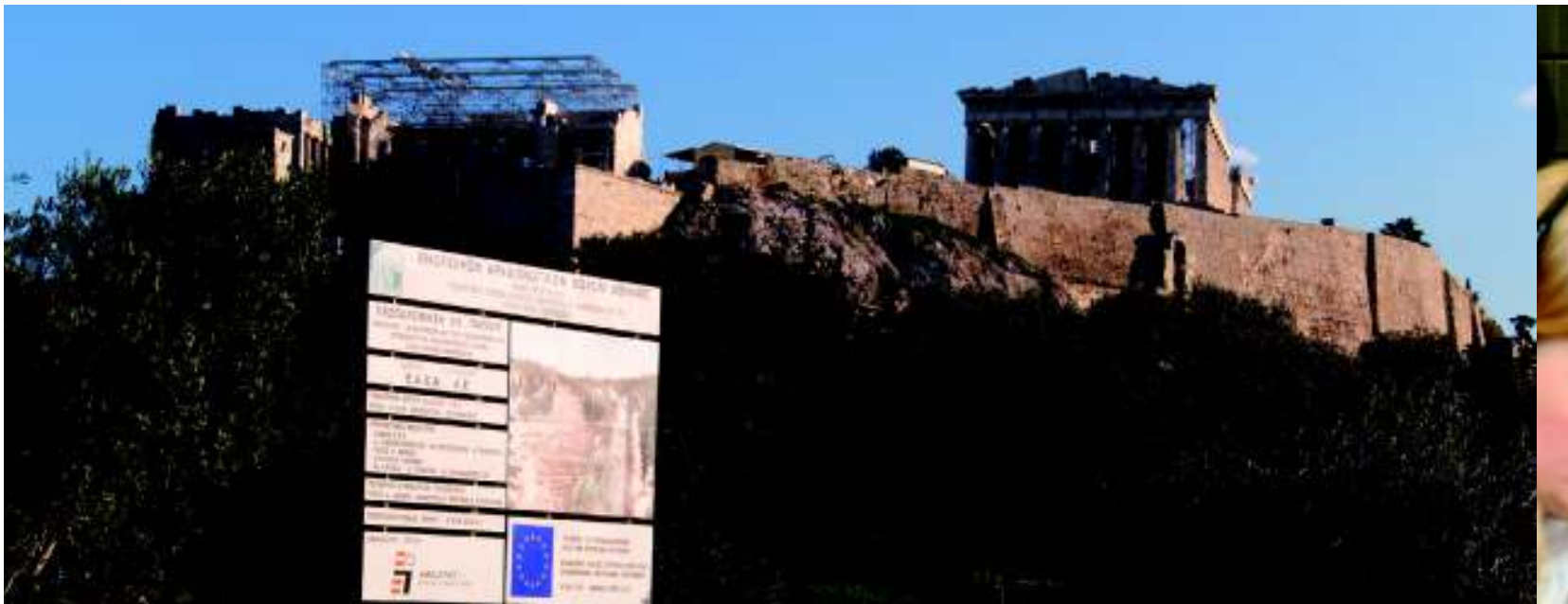
Păstrarea moștenirii culturale în Atena, Grecia