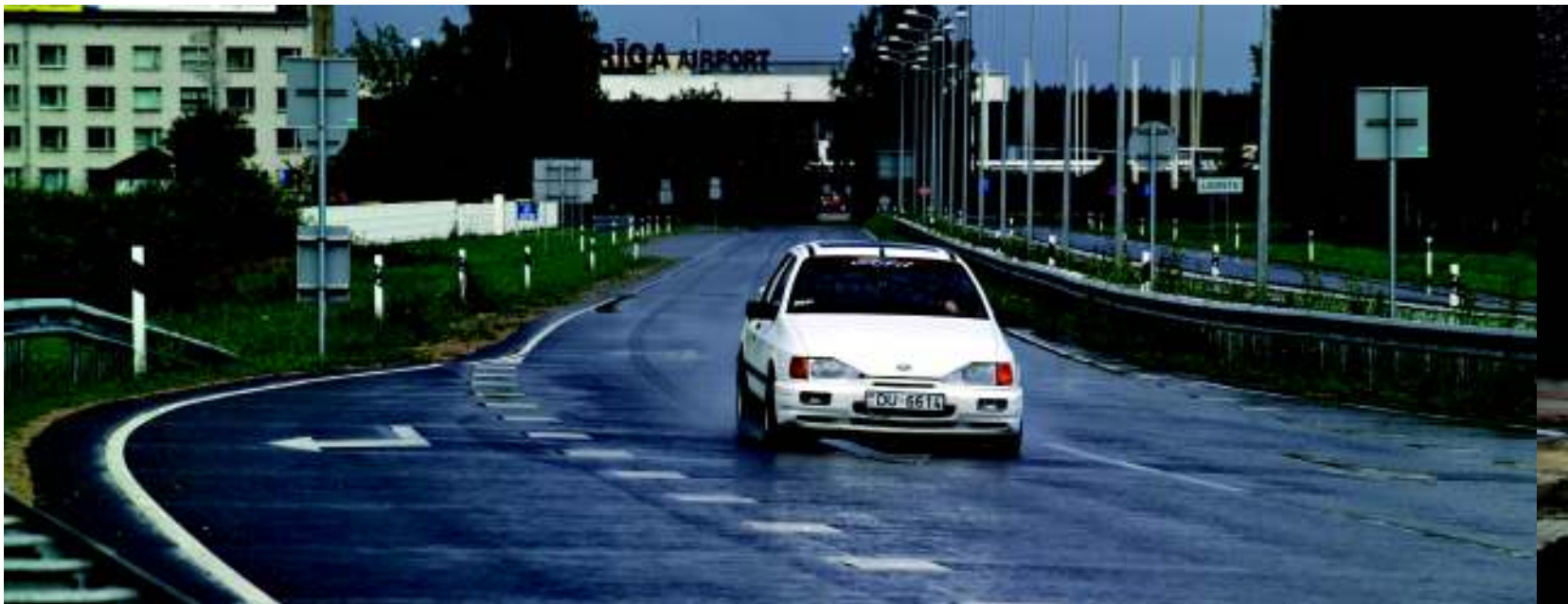
Noua pistă a aeroportului Riga din Letonia