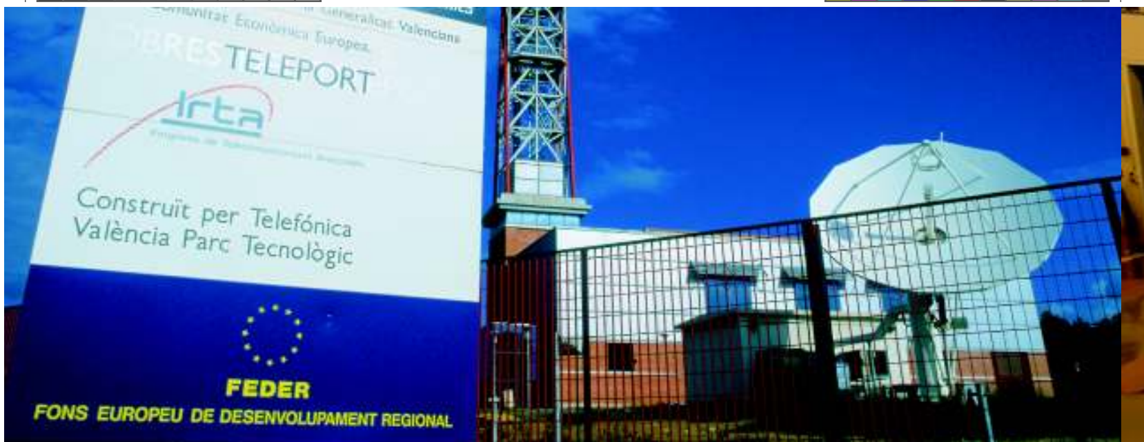
Parcul telecomunicațiilor în Valencia, Spania