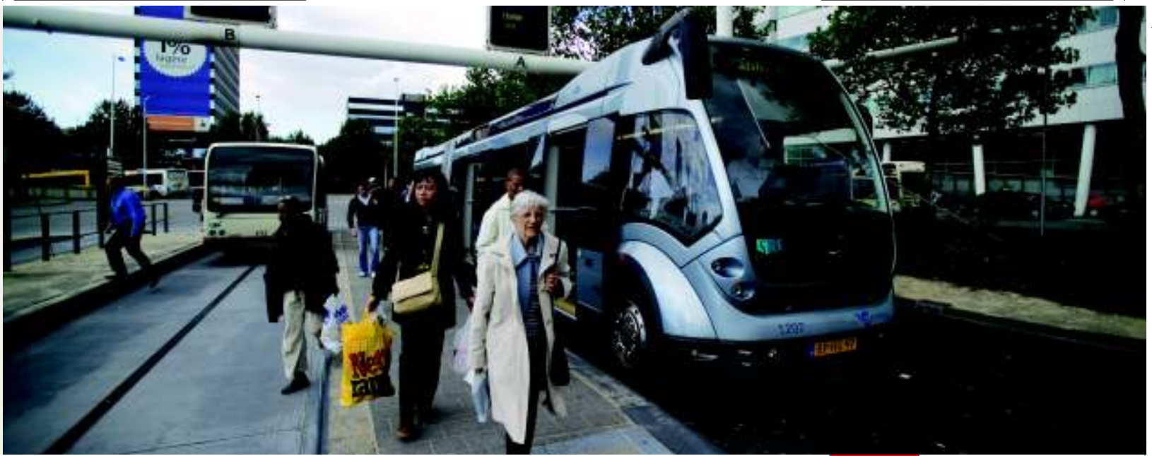
Phileas: inovații în domeniul transportului, Țările de Jos

publice de cercetare se va realiza prin intermediul grupurilor transregionale. A doua prioritate este sprijinirea cercetării și inovării în întreprinderile mici și mijlocii. A treia este impulsivarea cooperării transfrontaliere și transnaționale și ultima este întărirea infrastructurii de sporire a capacităților și a capitalului uman în zonele cu potențial semnificativ de creștere economică.