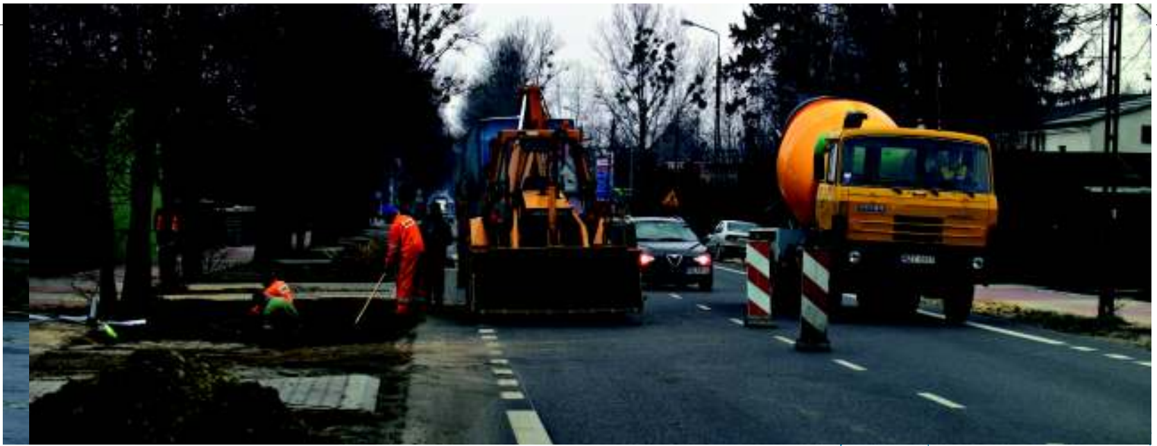
Construcție de străzi, Polonia