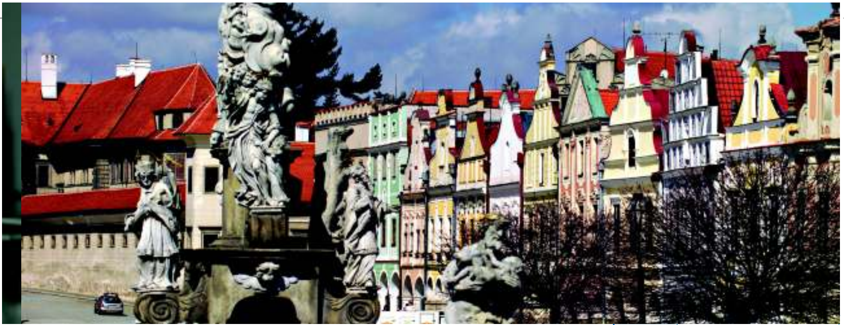
Centrul vechi al orașului Telc, Republica Cehă, atrage turiști