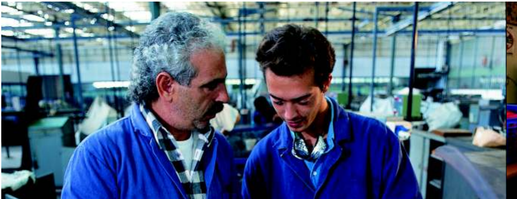
Calificare pe meserii în Italia