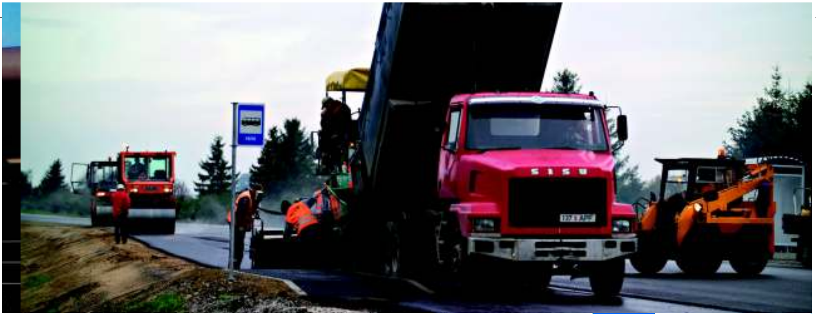
Noi căi rutiere în Estonia: șoseaua Via Baltica

■ Statele membre și regiunile care beneficiază de asemenea investiții realizează performanțe superioare în materie de creștere economică și ocuparea forței de muncă și sunt mai bine pregătite pentru a recupera mai rapid diferențele față de nivelul UE, decât dacă ar fi fost private de investițiile realizate grație politicii de coeziune.