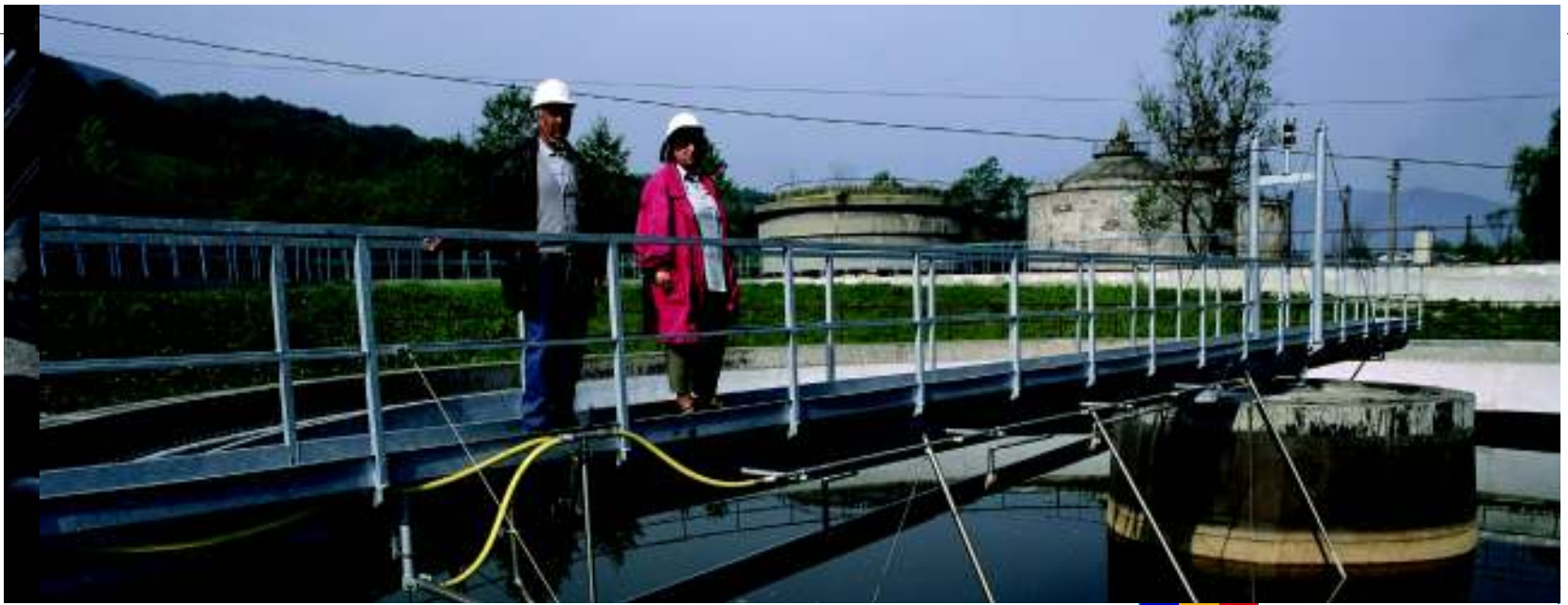
Noua stație de tratare a apei la Dănuțoni, lângă Petroșani, România