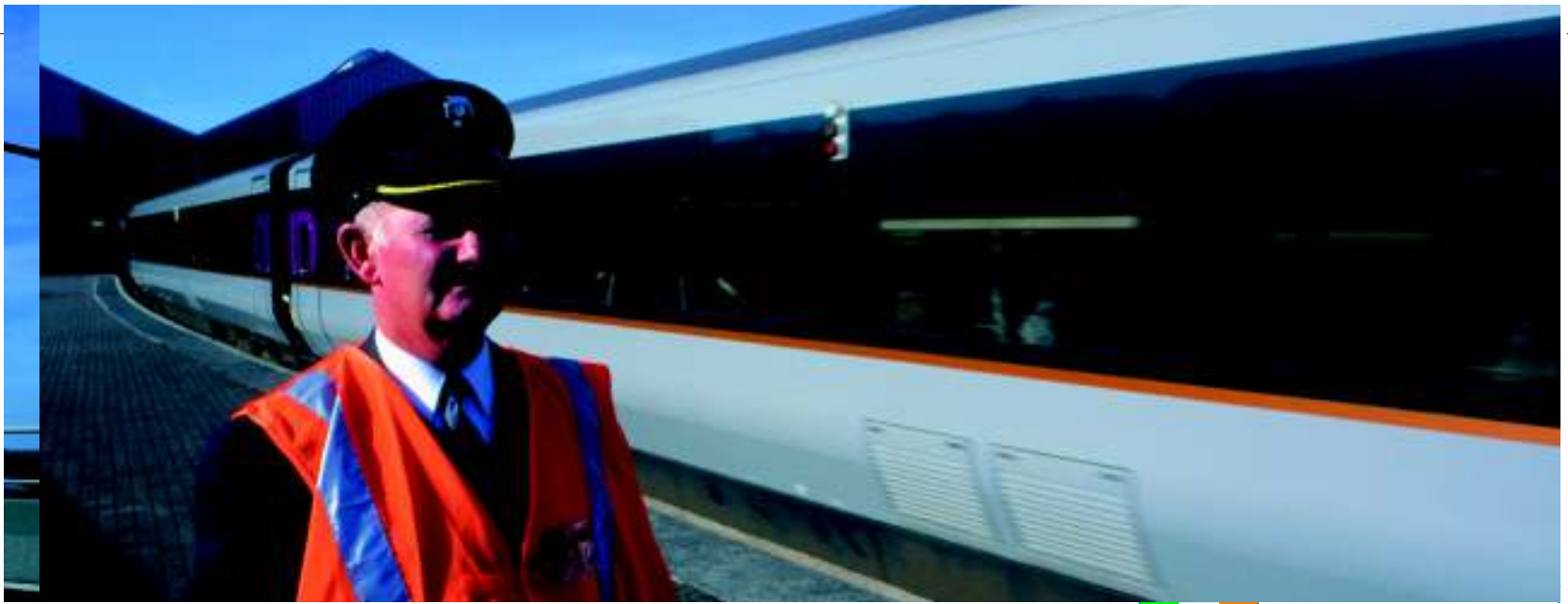
Calea ferată Belfast, Dublin, Irlanda