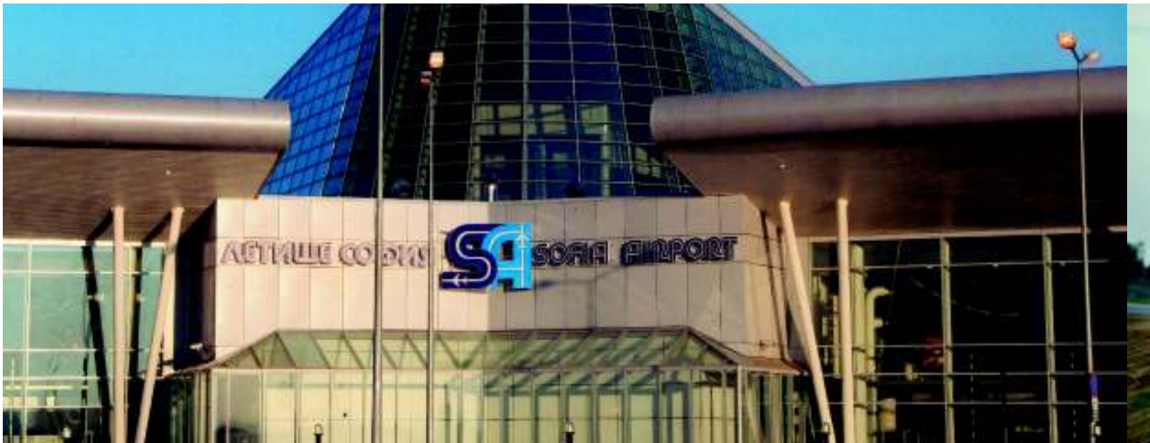
Noul aeroport din Sofia, Bulgaria