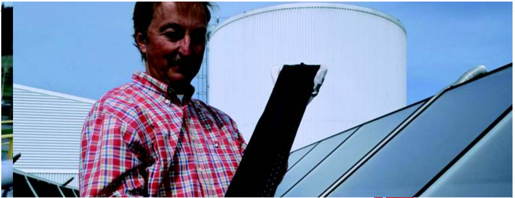
Promovarea surselor de energie eficientă: panouri solare în Marstal, departamentul Fyns, Danemarca